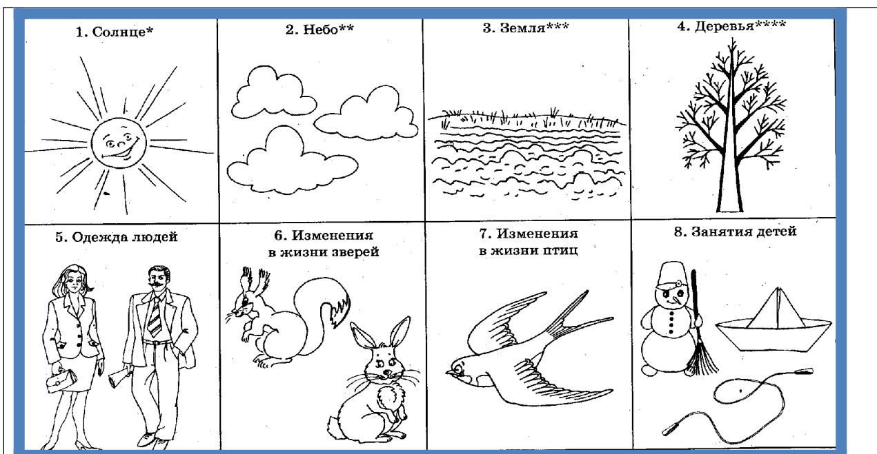
Схема по описанию времён года состоит из 8 признаков.

1 признак (солнце). Необходимо о нем рассказать. Дети говорят: «Солнце светит ярко», «Светит, но не греет» «Оно часто бывает за тучами», «Летом оно греет жарко».