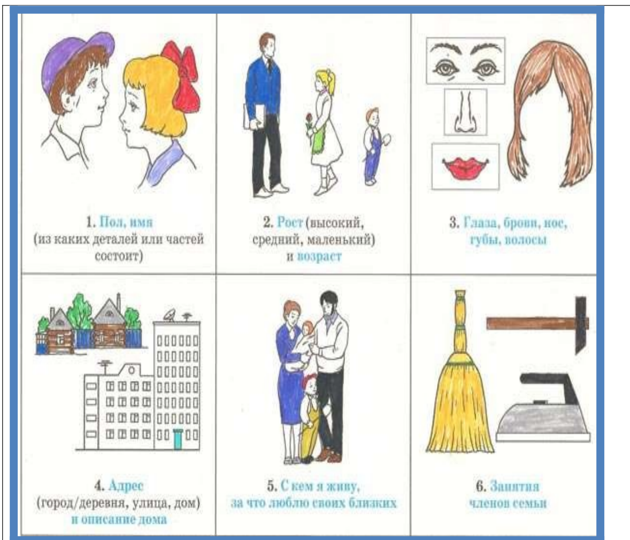
Схема для составления рассказов на тему «Человек» количество признаков увеличивается