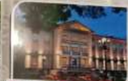
Санаторий им. Сеченова